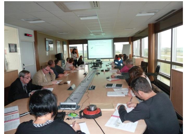
▲ Comité Liaison Environnement, juillet 2013

> La problématique poussières fait partie des thèmes discutés